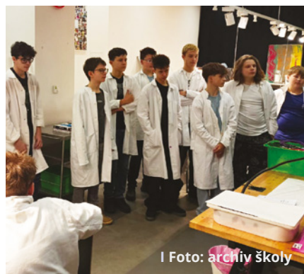
I Foto: archiv školy

Pro doplnění vědomostních znalostí žáci absolvovali také některé programy související s výukou. Mladší třídy se vypravily do brněnského planetária a zúčastnily se programu Velké dobrodružství , třetáci se v univerzitním kampusu stali „ Na den vědcem “, čtvrtáci se ponořili do světa programování v prostředí Scratch . Starší žáci se zapojili do STEM projektu , kde poznávali svět moderních technologií a vědy. Podnikli exkurze do technologických společností Garrett a AT&T a nechyběla ani návštěva vědeckého centra VIDA! , kde si na vlastní kůži vyzkoušeli desítky interaktivních experimentů (program Srdce na dlaní ). Novou aktivitou, do které jsme se přihlásili, je projekt Bezpečně do školy . V něm budeme společně s dětmi mapovat okolí školy a jejich bezpečnou cestu