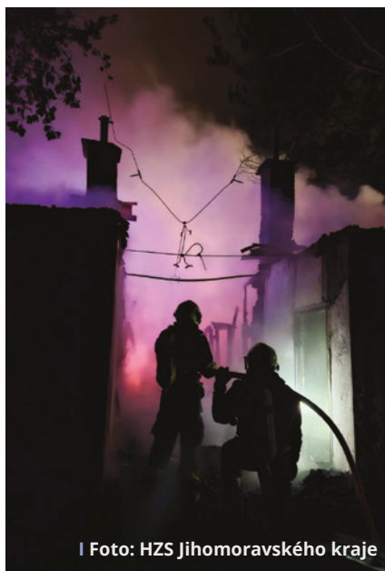
I Foto: HZS Jihomoravského kraje

Zároveň mezi sebe rádi přivítáme nové posily – ať už vás láká technika, trocha adrenalinu, náročný výcvik nebo prostě chcete být více aktivní ve své obci.